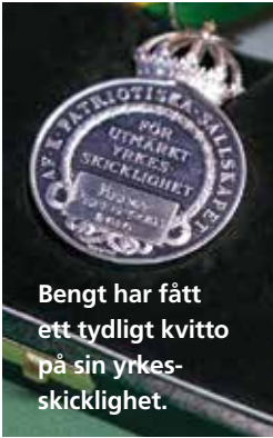
Bengt har fått ett tydligt kvitto på sin yrkeskicklighet.