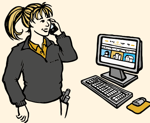
ILLUSTRATION: LENA WENNERSTÉN