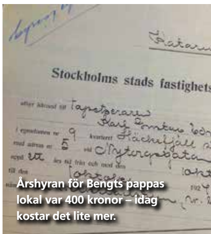
Årshyran för Bengts pappas lokal var 400 kronor – idag kostar det lite mer.