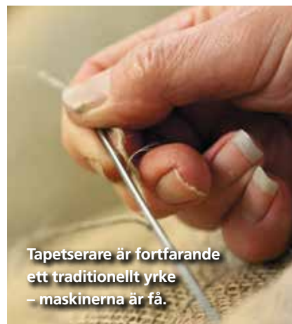
Tapetserare är fortfarande ett traditionellt yrke – maskinerna är få.

Kanske har miljötänkandet med hållbarhet gynnat oss. Vi gör en del stora jobb, som restauranginredningar, och då är det bra att vi kan samarbeta.