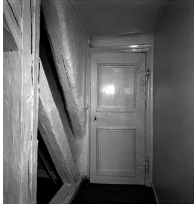
RENÄSSANSDÖRR FRÅN 1600-TALET FÖRRA HÄLFT MED FODER FRÅN 1700-TALET.