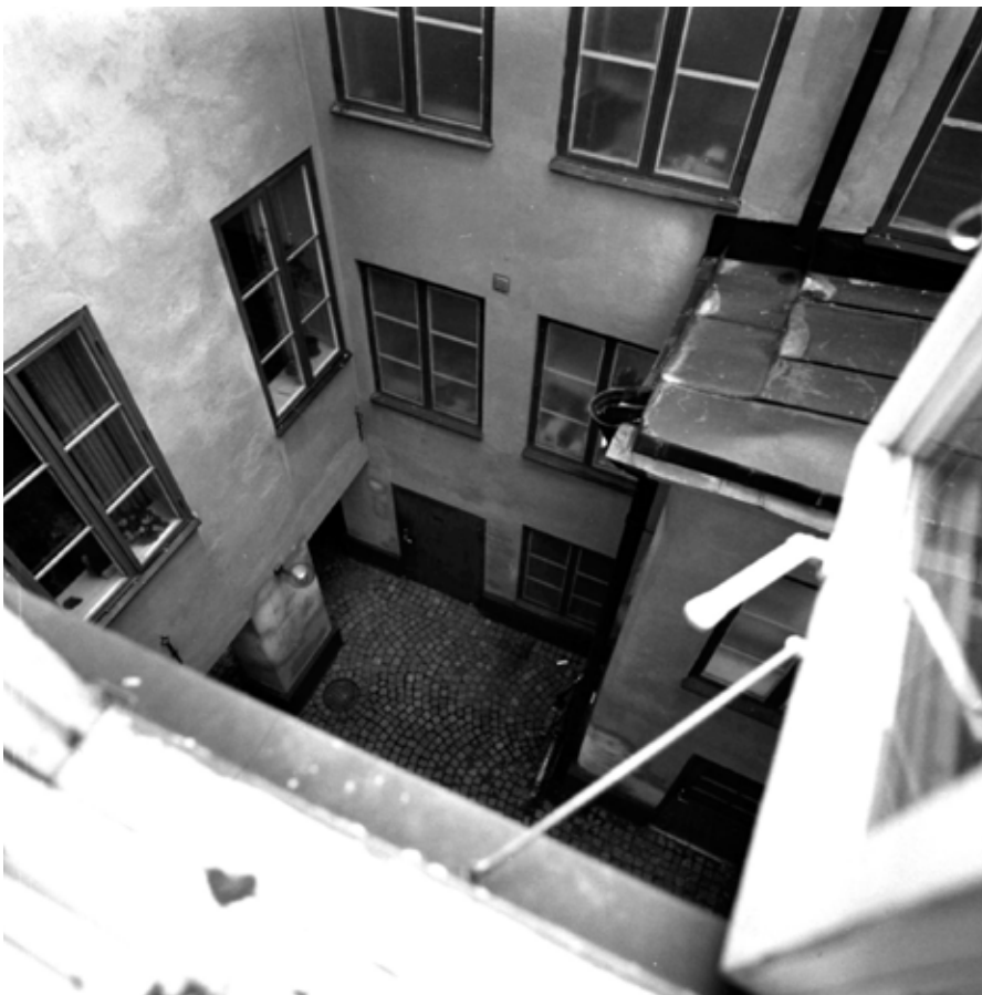
GÅRDEN SEDD UPPIFRÅN. TILL VÄNSTER SYNS DEN SÖDRA FLYGELN MED GENOMBRUTEN BOTTENVÅNING MOT GRANNENS GÅRD. FOTO: G. FREDRIKSSON, SSM. 5-93: 0502:4