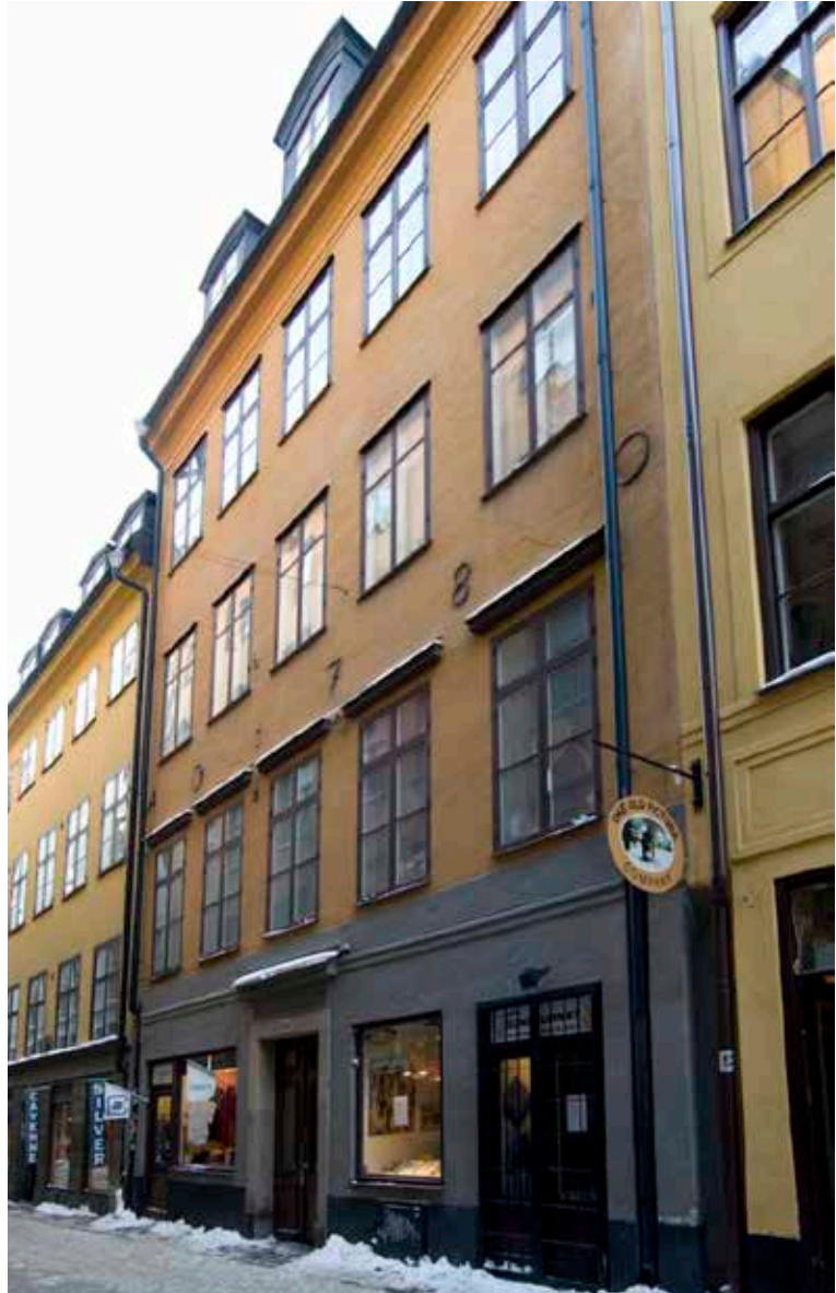
FASADEN ÄR SLÄTPUTSAD I TVÅ FÄRGER. EFTER OMBYGGNADEN 1780 PRYDDES FASADEN MED ANKARSLUTAR DÄR ÅRTALET ANGES. PORTALEN ÄR FRÅN SAMMA OMBYGGNAD.