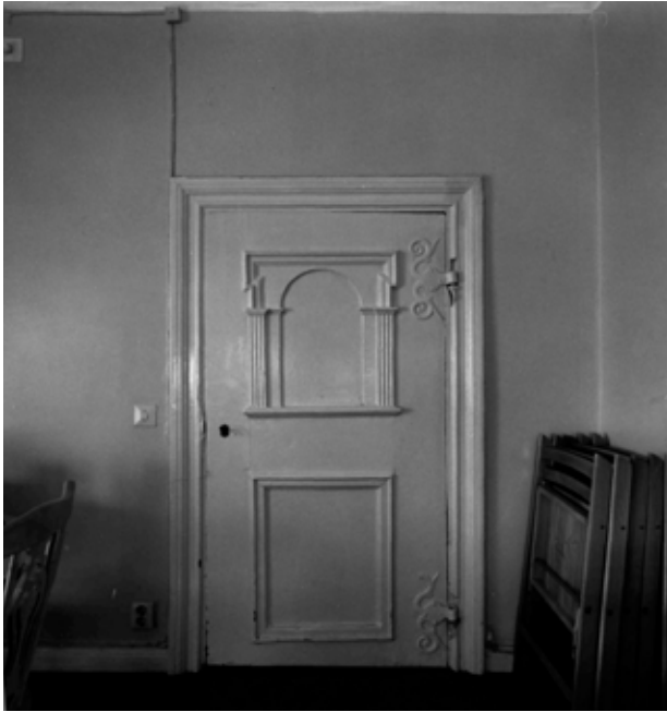
RENÄSSANSDÖRR FRÅN 1630-TALET MED FODER FRÅN 1700-TALET. FOTO: G. FREDRIKSSON 1993, S93-0501:1.