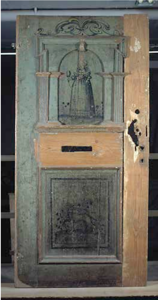
MÅLAD RENÄSSANSDÖRR FRÅN 1630-TALET, URSPRUNGLIGEN FRÅN TYPHON 7 MEN SEDAN 1979 I STOCKHOLMS STADSMUSEUMS SAMLINGAR. INVENTARIENUMMER 47250.

och kunde ha dekor i form av blinderingar, formtegel eller mönstermurning. Den medeltida, oregelbundna stadsplanen är ännu i dag mycket väl bevarad och många hus har i hög utsträckning kvar medeltida murverk bakom senare tiders fasadutformningar och inredningar.