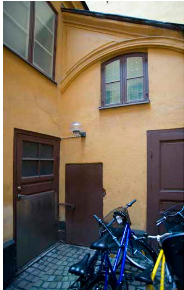
GÅRDEN ÄR BELAGD MED SMÅGATSTEN. PÅ BILDEN SYNS DEN VÄSTRA LÄNGAN OCH DET NORRA TRAPPHUSET, MARKERADE MED NR 3 PÅ KARTAN.

låneunderlaget för statliga tilläggsån skulle en kulturhistorisk inventering med historisk utredning ingå. De första fastigheterna där detta genomfördes var Typhon 6 och 7 år 1977. Renoveringen påbörjades 1979. Fastigheten saknade centralvärme och varmt vatten. Lägenheterna fick moderna kök och våtutrymmen vilket i vissa fall innebar nya innerväggar inom befintliga rum. En förbindelse till grannfastigheten Typhon 6 gård togs upp genom gårdsflygeln. Förslag till skyddsföreskrifter upprättades inför en eventuell byggnadsminnesförklaring som ej kom till stånd.