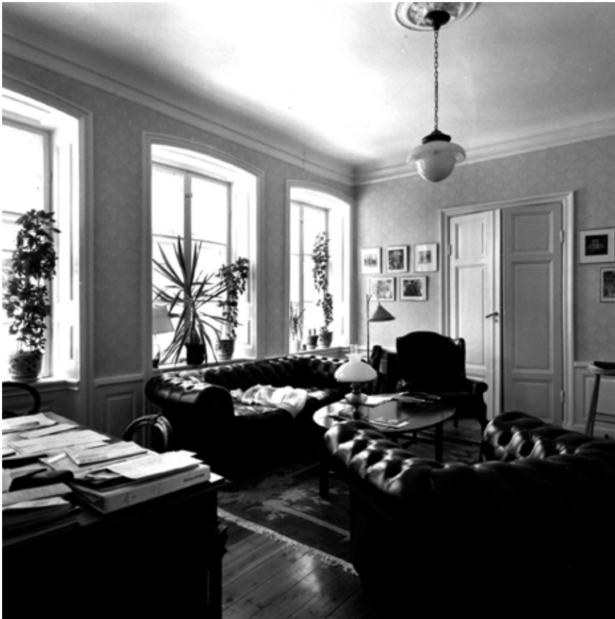
RUMMET HAR KORVBÄGIGA FÖNSTER MED SMYG- OCH BRÖSTPANELER FRÅN 1700-TALET. TAKLISTEN, FÖNSTERFODREN OCH FÖRMODLIGEN BRÖSTPANELEN ÄR SAMTIDA. PARDÖRRARNA OCH TAKROSETTEN ÄR FRÅN 1800-TALET. FOTO: G. FREDRIKSSON 1993, S93-0490:12.