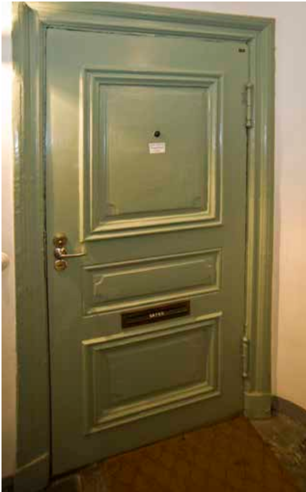
HELFRANSK LÄGENHETSDÖRR FRÅN 1700-TALET MED SAMTIDA DÖRRFODER OCH GÅNGJÄRN. DÖRREN HAR Fyllningar med NUPNA HÖRN.