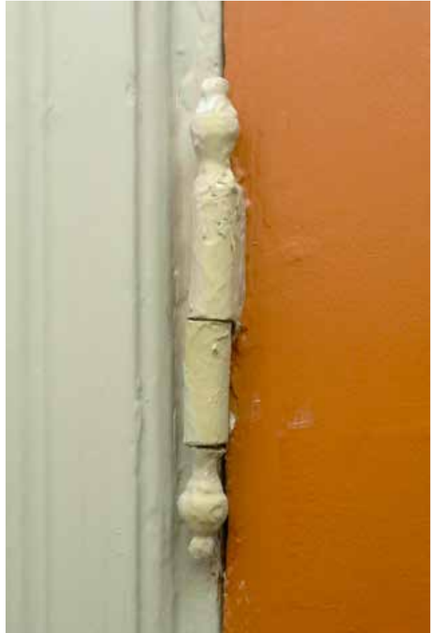
GÅNGJÄRN AV EN TYP SOM VAR VANLIG PÅ 1700-TALET I EN AV TRAPPHUSETS DÖRRAR VID HORNSGATAN.

den lilla parken som i dag har namnet Bysistäppan, inköptes 1833 av staden till rastgård för de intagna.