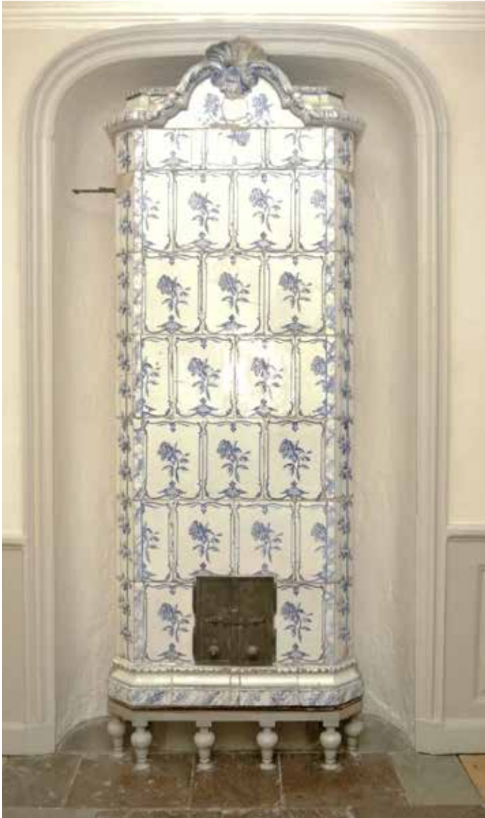
KAKELUGN FRÅN 1700-TALET I PARADVÅNINGEN VID HORNSGATAN, DEPONERAD UR STADSMUSEETS SAMLINGAR.

inventering och skrev skyddsföreskrifter för byggnaderna. Renoveringen innebar bland annat nya ytskikt och tekniska lösningar för ventilation och dylikt men även ett visst återställande av husets äldre karaktär, framför allt i paradvåningen mot Hornsgatan.