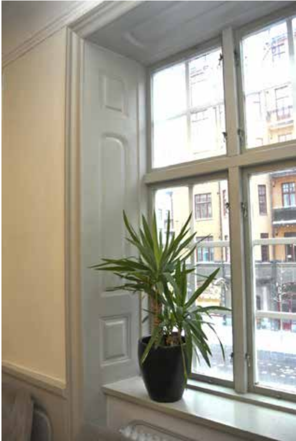
FÖNSTERSMYGPANEL OCH FODER FRÅN 1700-TALET I PARADVÄNINGEN MOT HORNSGATAN.