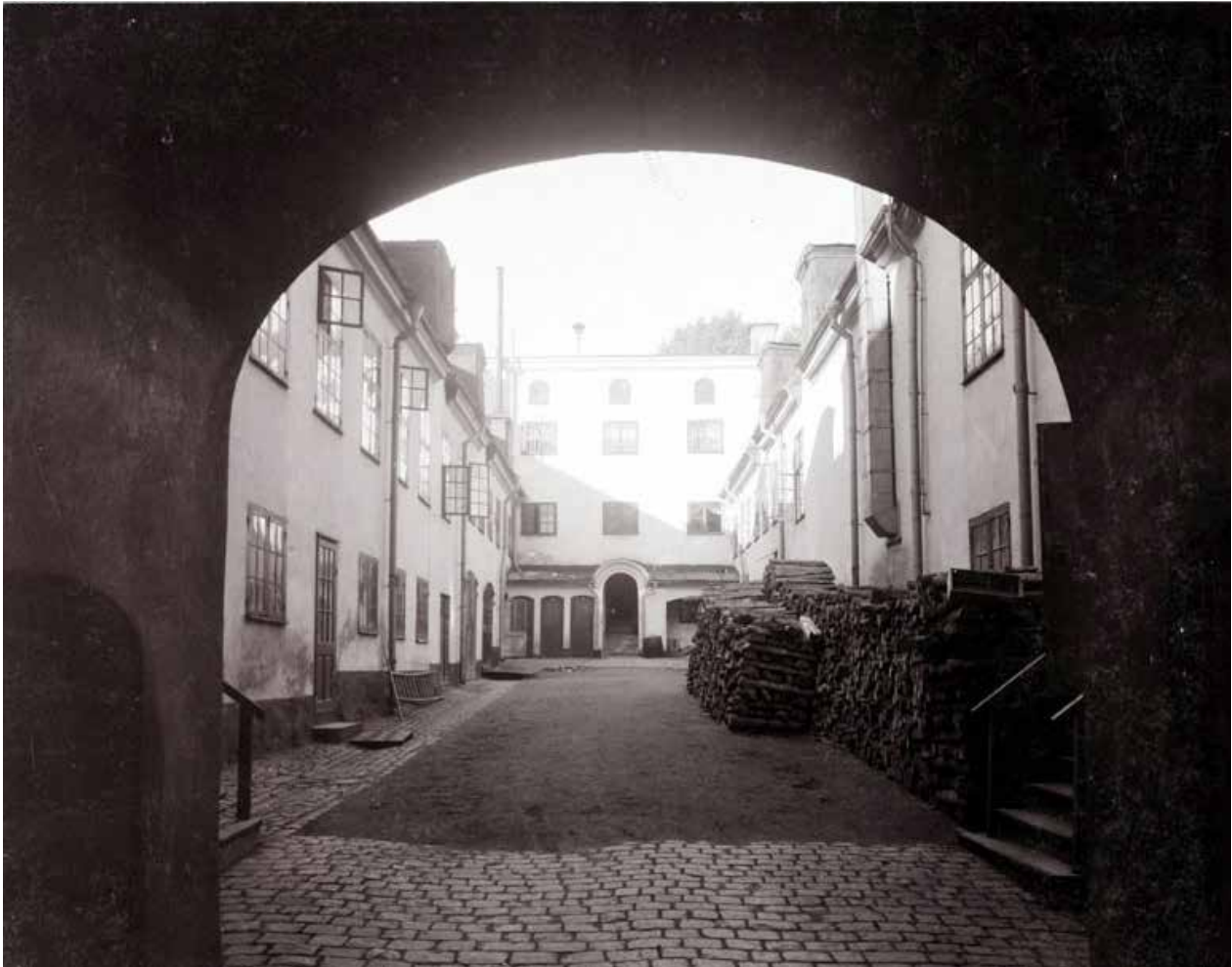
SAMMA VY 1906 . PÅ FLYGLARNAS TAK SITTER STORA TAKKUPOR FÖR INTAG AV VAROR O.DYL SOM SENARE HAR TAGITS BORT, ANNARS ÄR INTE MYCKET FÖRÄNDRAT PÅ MER ÄN 100 ÅR. FOTO LARSSONS ATELJÉ, SSM FA49561.

gatan från hans tid; en sängkammare med alkov ingick i ett representativt hem vid den här tiden. Wiese sålde 1773 fastigheten till Inkvarteringskommissionen som tänkte använda byggnaderna till kaserner för militären. Åtta år senare övertogs fastigheten av Stockholms stad, och den legendariska tiden som bysättningshäkte inleddes.