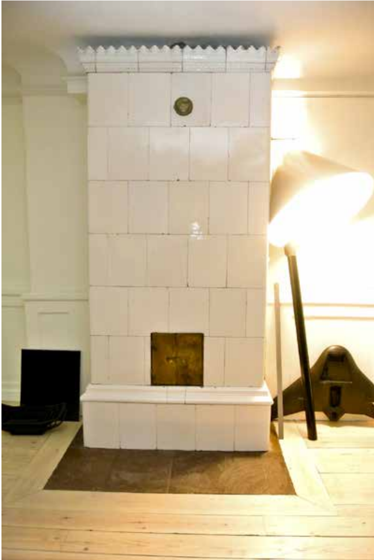
KAKELUGN FRÅN 1800-TALET PÅ VÅNING 2 TRAPPOR VID HORNSGATAN.