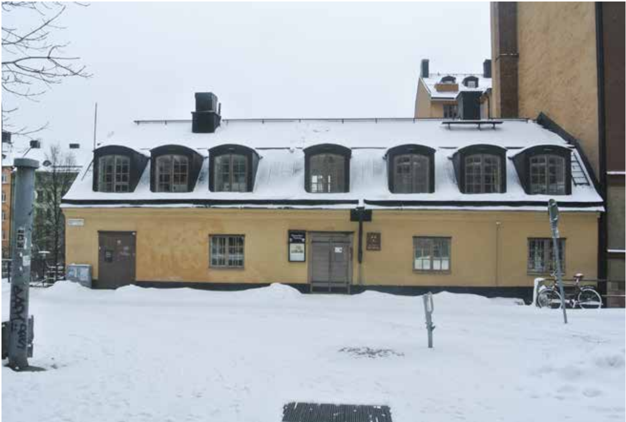
BYGGNADEN VID BRÄNNKYRKAGATAN HAR EN OKLAR BYGGNADSHISTORIA MEN FANNS HÄR ÅTMINSTONE 1758, DÅ DEN NÄMNS I EN BRANDFÖRSÄKRING. DE SJU TAKKUPORNA NÄMNS OCKSÅ I FÖRSÄKRINGEN, MEN HAR MÖJLIGEN FÖRSTORATS VID ETT SENARE TILLFÄLLE.

rät vinkel från norr och söder och de båda gatorna blev utgångspunkten för de raka gator och rätvinkliga kvarter som sedan växte upp på malmen. Ordet horn betyder förmodligen ”utskjutande landparti” och förknippas sedan medeltiden med Södermalms västra udde vid nuvarande Hornstull.