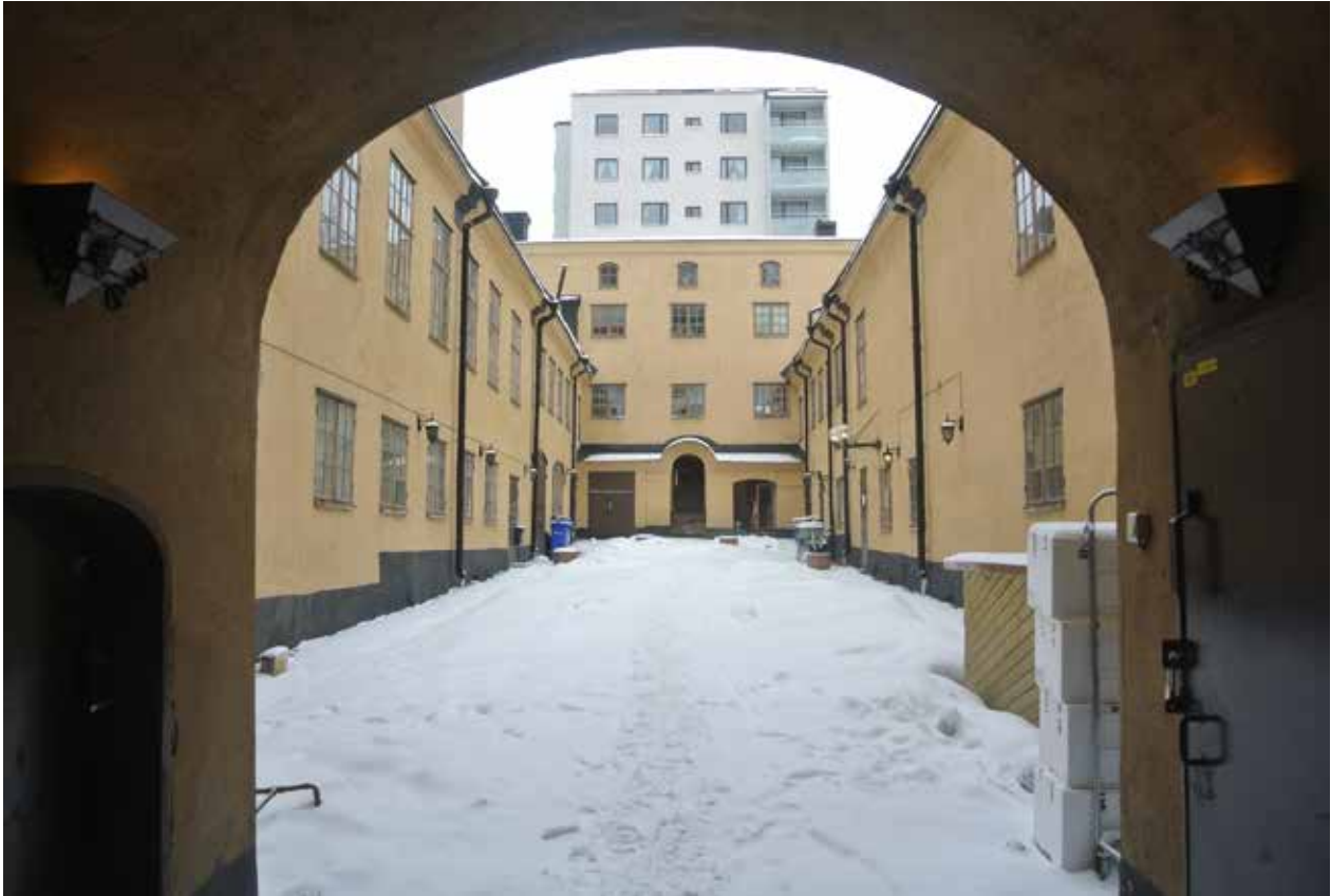
DEN LÅNGSMALA, KARAKTERISTISKA GÅRDEN FRÅN PORTGÅNGEN VID HORNSGATAN. DEN LÅGA UTBYGGNADEN PÅ HUSET I FONDEN INNEHÅLLER EN TRAPPA OCH HÄR FANNNS URSPRUNGLIGEN ÄVEN UTEDASS.

och ägde två stenhushus och ett trähus i Stockholm.