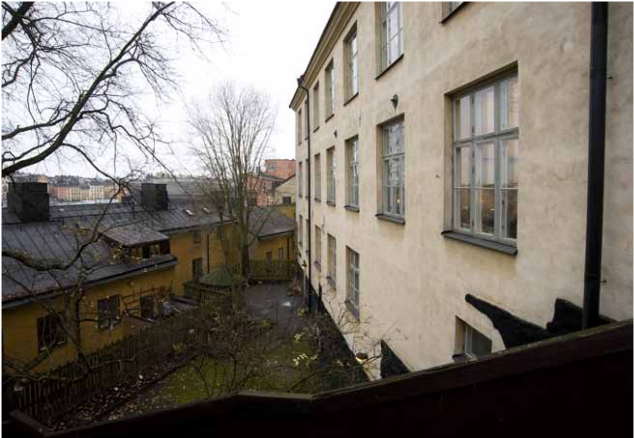
FASADEN MOT NORR MED GÅRDSUTRYMME.