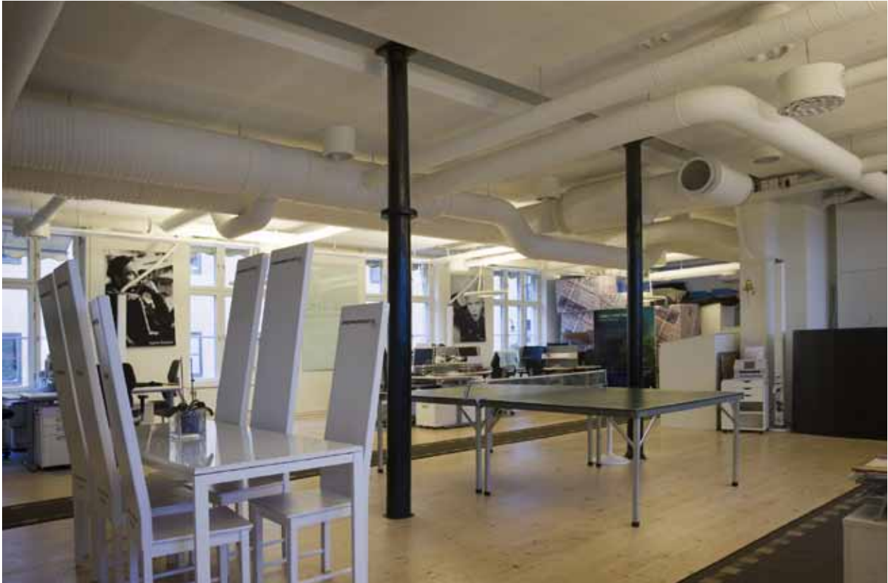
KONTORSLOKAL MED ÄLDRE GJUTJÄRNSPELARE.

var enkelt inrett med bjälktak, brädgolv, trappor av sten och trä.