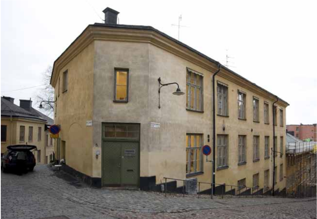
HUSET MED FASAT HÖRN OCH ENTRÉ I KORSNINGEN BRÄNNKYRKAGATAN/MARIA TRAPPGRÄND. MOT MARIA TRAPPGRÄND ÄR FASADEN NÅGOT UTBUKTAD.

Tidens kända murmästare fick uppdrag i området och byggherrarna var ofta framgångsrika näringsidkare som både bodde och drev sin verksamhet i de nya husen. Under 1800-talet byggdes en stor del av husen om, och framförallt längs Hornsgatan fick husen påbyggnader och ny fasaddekor. Mot slutet av 1800-talet uppfördes också en del nya byggnader som Mariahissen och Laurinska huset.