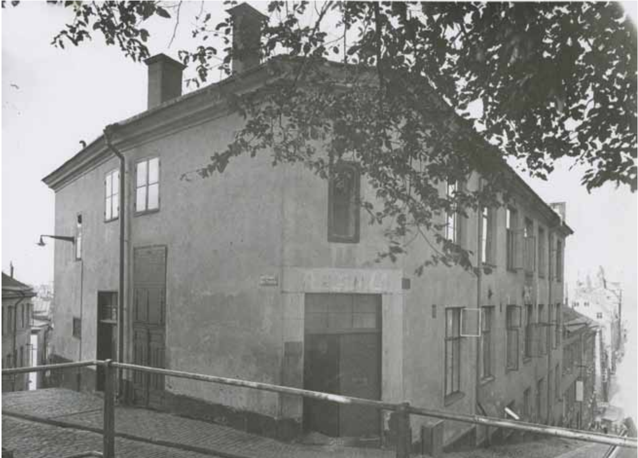
ÄLDRE BILD FRÅN ÅR 1943. (F57998)

Området kring Fotangeln 3 har igenom alla tider varit gynnsamt för näringsidkare tack vare närheten till Mälarens vatten. Huset, som byggdes år 1800, är just ett sådant exempel.