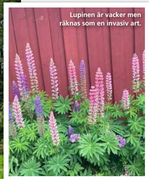
Lupinen är vacker men räknas som en invasiv art.