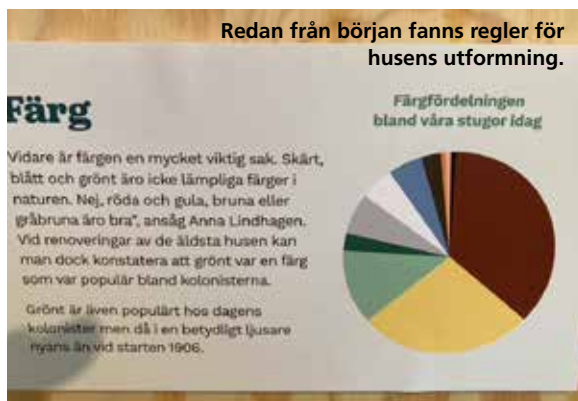
Redan från början fanns regler för husens utformning.