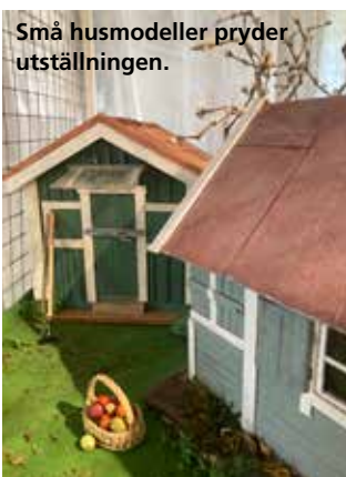
Små husmodeller pryder utställningen.