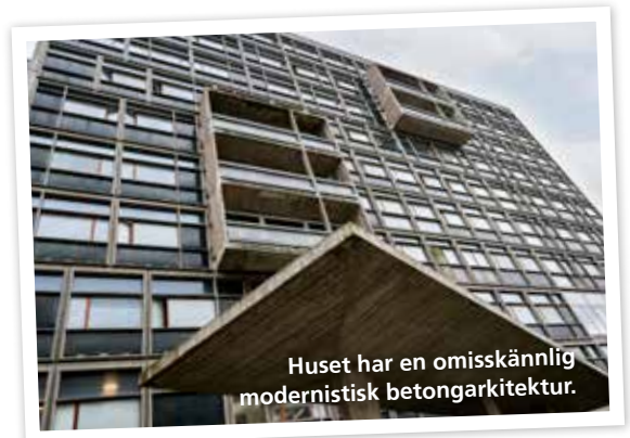
Huset har en omiskännlig modernistisk betongarkitektur.