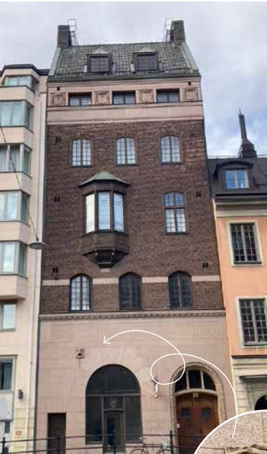
Huset har en vacker fasad med en hel del utsmyckningar.

Läs mer på hemsidan: www.openhousetockholm.com