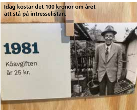
Idag kostar det 100 kronor om året att stå på intresselistan.