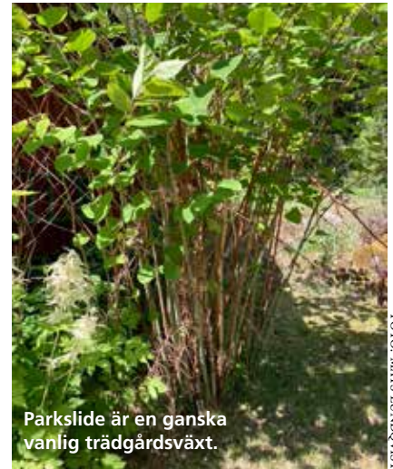
Parkslide är en ganska vanlig trädgårdsväxt.

– Just parkslide får anses som en av de mest problematiska invasiva arterna, säger Stadsholmens trädgårdssamordnare Åsa Manhem. Detta eftersom den