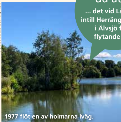
1977 flöt en av holmarna iväg.

OM DU GÅR ner till bryggan nedanför Herrängens gård och tittar till höger så ser du dem.