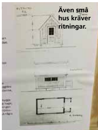
Även små hus kräver ritningar.