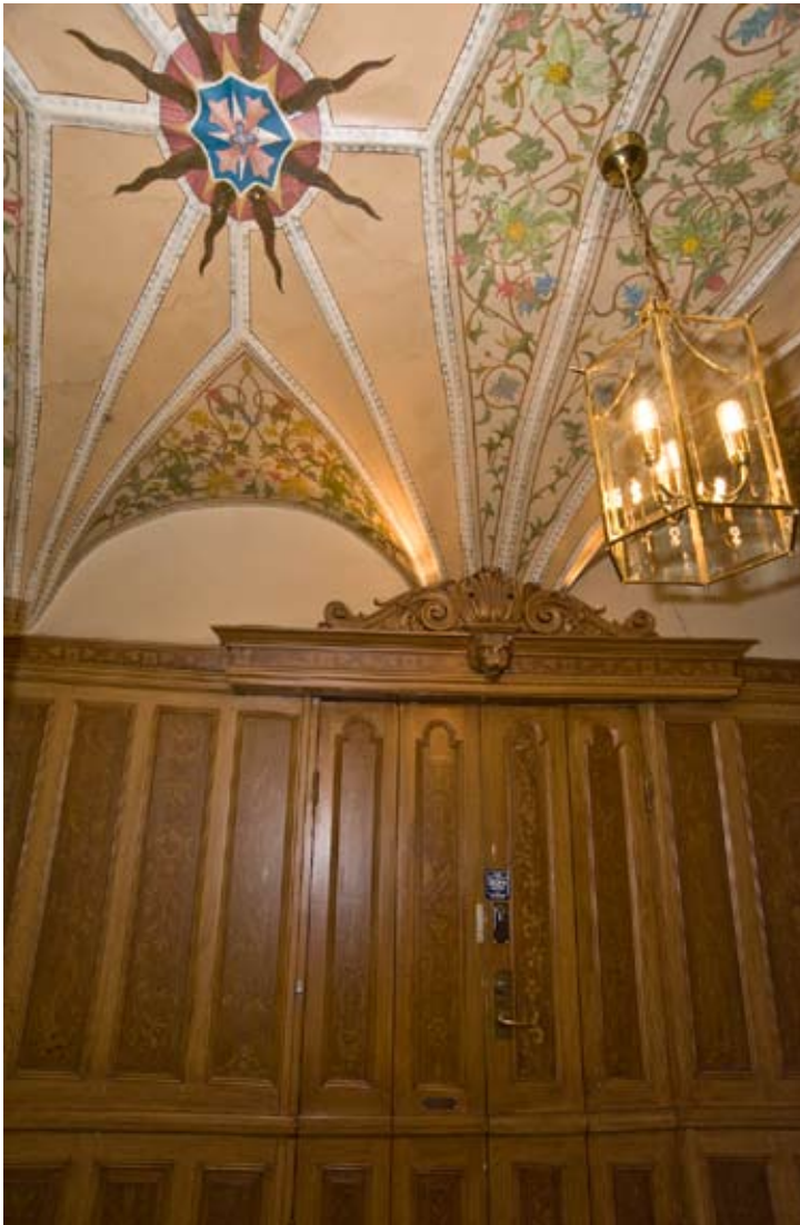
PORTGÅNGEN FICK EN HÖG TRÄPANEL OCH DE ÄLDRE VALVEN EN DEKORATIV MÅLNING VID 1861 ÅRS RENOVERING.

Till gårdsrummet ledde en välvd inkörsport. Från gården fanns trärappor upp till köken i det västra husets våningsplan. Detta bör ha inneburit att tjänstefolk och ägare kunde röra sig inom olika delar av huset utan att behöva mötas. Det västra huset hade säteritak.