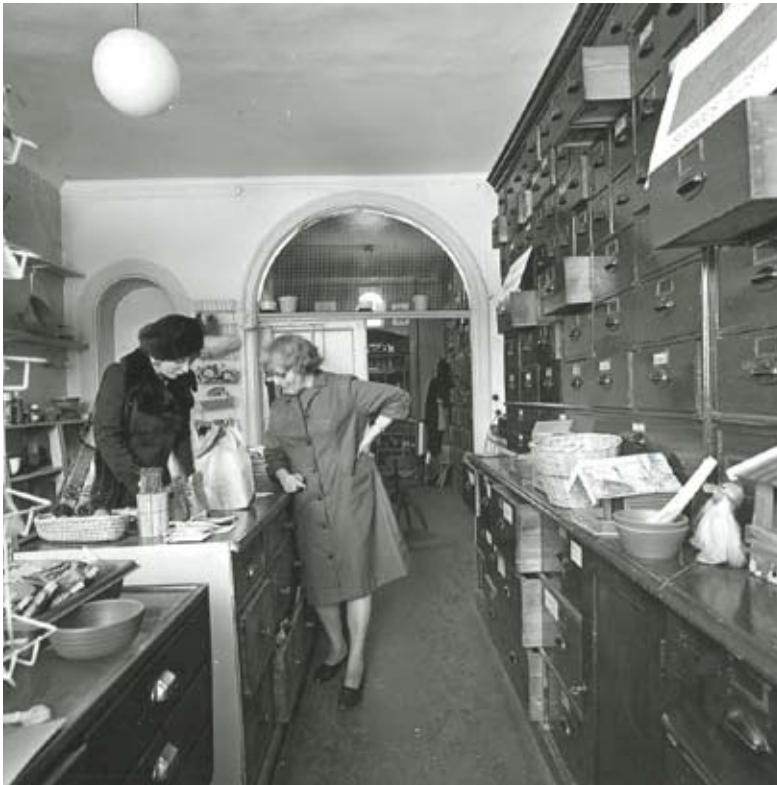
INTERIÖR I SELBERGS FRÖHANDEL SOM LADESNER 1971.