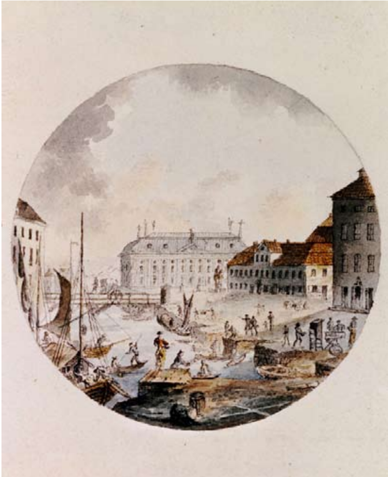
MILON 1 SKYMTAR LÄNGST TILL HÖGER I BILD MED SÄTERITAK MOT MUNKBRON. ETSNING AV J. P. CUMLIEN, FÖRE OMBYGGNADEN 1819. SSM 502620.

husen. Byggnaderna fick stora vindar i flera våningar med höga, branta tak och ofta en dekorativ fasadutsmückning i natursten. Samtidigt anpassades de nybyggda husen längs framför allt Nygatorna i väster till en reglerad stadsplan.