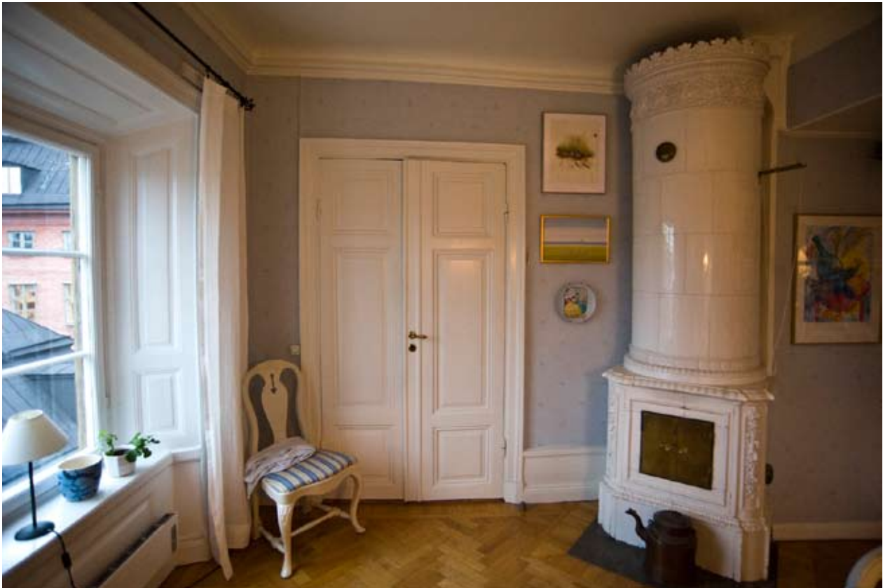
EN VÄLBEVARAD 1800-TALSINREDNING MED KAKELUGN, PARKETTGOLV, FÖNSTER- OCH DÖRRSNICKERIER SAMT TAKLIST.

gränd präglas av 1860-talets renovering med putsad dekor i nyrenässansstil och en påbyggd attikavåning med parställda, rundbågiga fönsteröppningar. Bottenvåningen är rusticerad med tre stora rundbågiga öppningar åt väster varav den mellersta är portgångens entré. Mot gränden i norr har bottenvåningens fönsteröppningar skulpterade fönsterluckor. Dörrbladet till det östra trapphuset har på baksidan skulpterad dekor i samma stil som fönsterluckorna medan dörren till den före detta körporten är sentida. Ett fönster i norra fasaden har äldre bågar och beslag, övriga har bytts under 1900-talet. Mot gata och gränd har det plåtklädda taket enkelt fall ovan en oinredd hanbjälksvind.