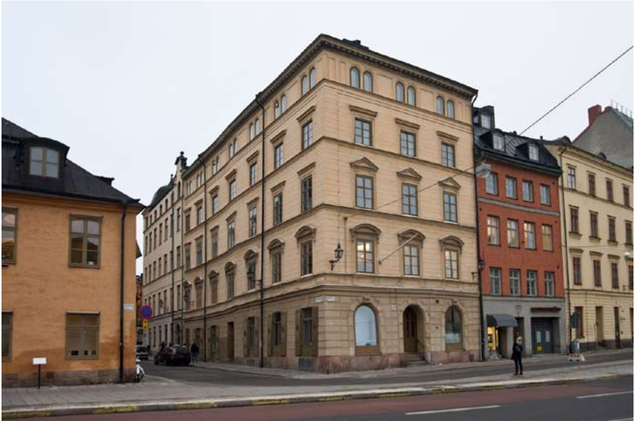
EXTERIÖREN PRÄGLAS AV EN RENOVERING OCH PÅBYGGNAD 1861 ENLIGT RITNINGAR AV J. F. ÅBOM. FASADERNA FICK ENLIGT TIDENS MODE EN PUTSDEKOR I NYRENÄSSANSSTIL. BYGGNADEN HAR GRUNDFÖRSTÄRKT OCH SPÅREN AV SÄTTNINGAR SYNS I DEN "KNYCK" SOM FINNS I MITTEN AV FASADEN MOT STORA GRÄMUNKEGRÄND.