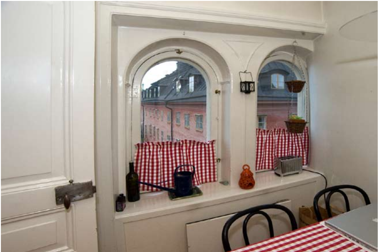
DEN ÖVERSTA VÅNINGEN BYGGDES PÅ 1861. I FLERA AV LÄGENHETERNA FINNS FAST INREDNING SEDAN UPPFÖRANDET.

Maria gifte sig med den tretton år yngre Carl Fredrik som 1856 sålde tryckeriet till Albert Bonnier. Efter det tycks Björklund ha dragit sig tillbaka från arbetslivet, endast 42 år gammal. Enligt mantalslängden 1860 bodde paret med ett barn i Milon 1. Vid renoveringen fick fasaderna enligt tidens mode en putsdekor i nyrenässansstil. De två butiksfönstren och entréporten i bottenvåningen mot Munkbron fick tre lika stora rundbågiga öppningar. Fastigheten påbyggdes med en delvis inredd attikavåning med fönster mot gatan och gränden. Portgången mot Munkbron fick ett nytt golv av marmor liksom vilplanen på våning 1 och 2 trappor. Trapploppet fick nya rundbågiga fönsteröppningar mot gården. I stort sett alla kakelugnar byttes ut och flera av rummen i de tre bostadvåningarna fick parkettgolv. På våning 2 trappor var dessa mönsterlagda av tre träslag, förmodligen ek, mahogny och lönn.