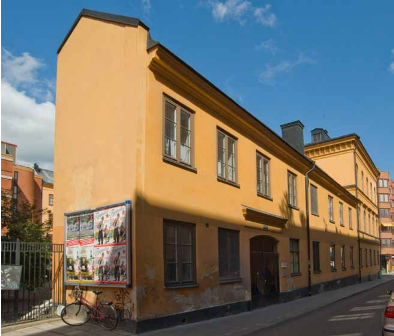
LÄNGAN MOT BRUNNSGATAN BYGGDES VID OLIKA TIDER PÅ 1700-TALET. DEN ÖVERBYGGDA PORTGÅNGEN NÄRMAST ÄR FRÅN 1779 OCH HADE UNDER EN PERIOD BOSTADSRUM ÅT BAGARGESÄLLERNA PÅ ÖVERVÅNINGEN.