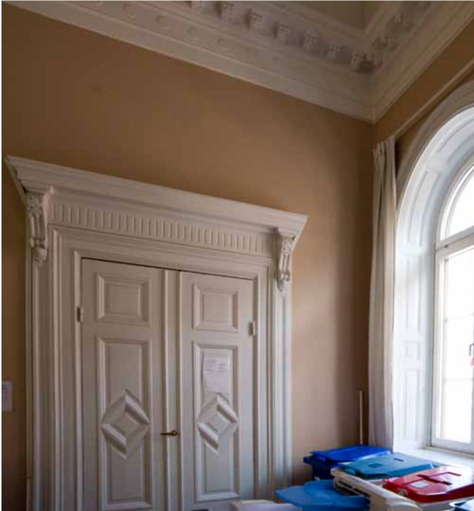
DEL AV FÖNSTER, DÖRR OCH TAKLIST FRÅN 1881 I SKOLANS AULA PÅ VÅNINGEN HÖGST UPP.

till 1926 och 1947 förvärvade staden fastigheten. Efter skoltiden har bland annat Klara polisstation och senare Stockholms stads arbetsförmedling använt lokalerna.