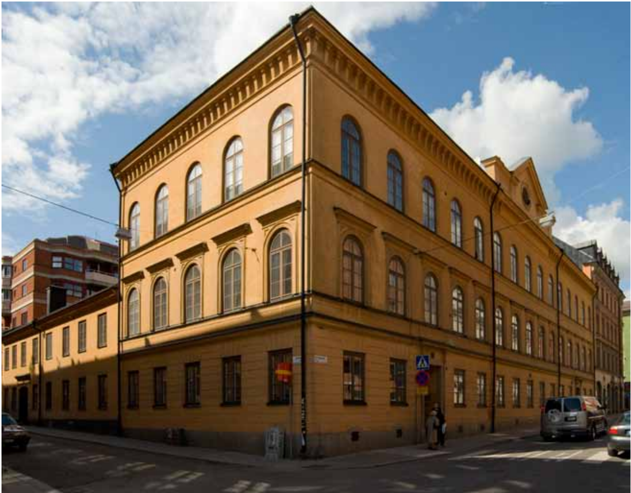
SKOLHUSET BYGGDES 1849 OCH BYGGDES PÅ 1881. DE RUNDBÅGIGA FÖNSTREN, DEN KRAFTIGA TAKLISTEN OCH DET FLACKA TAKET ÄR TYPISKA FÖR NYRENÄSSANSARKITEKTUREN VID DEN HÄR TIDEN. FOTO J. MALMBERG.

Stockholm expanderade kraftigt under 1600-talets första hälft bebyggdes Norrmalm i en allt större omfattning. Den nuvarande gatusträckningen och kvarterindelningen följer i stora drag den stadsplan som genomfördes under decennierna omkring mitten av 1600-talet. Utefter huvudgatorna Drottninggatan och Regeringsgatan byggdes i allmänhet stenhus, medan de mindre tvärgatorna karakteriserades av trähusbebyggelse. I kvarteret Väderkvarnen fanns, som namnet anger, en väderkvarn.