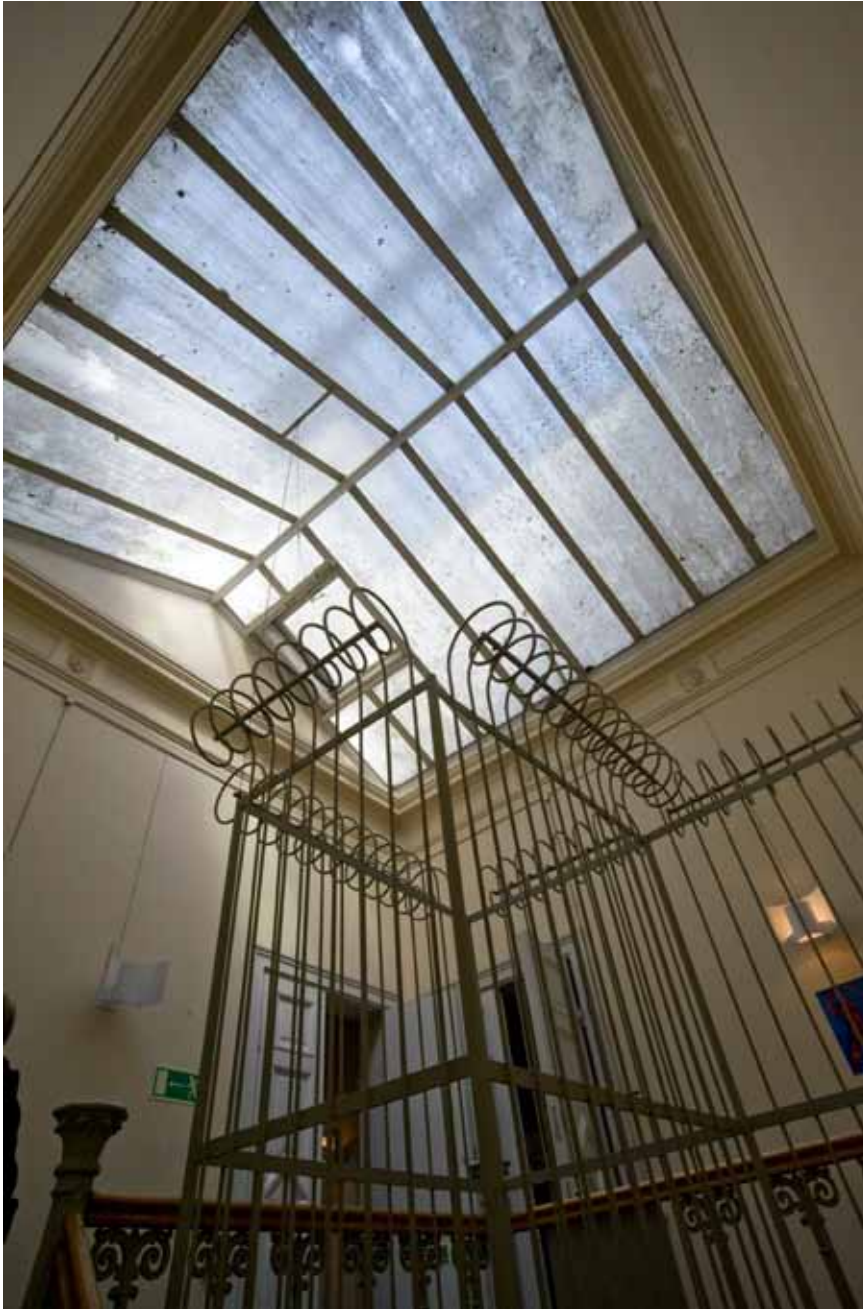
SKOLBYGGNADENS TRAPPHUS MED ÖVERLJUSFÖNSTER OCH DEKORATIVT TRAPPRÄCKE AV GJUTJÄRN.

en trevånig länga med 15 fönsteraxlar mot Regeringsgatan och fem mot Brunnsgatan. Våningarna avdelas av kraftiga putslistor och takfoten är dekorativt utformad. Fönstren i de två övre våningarna är rundade och i mellenvåningen omges de av dekorativa fönsteromfattningar av puts. De två entréerna markeras genom släta omfattningar.