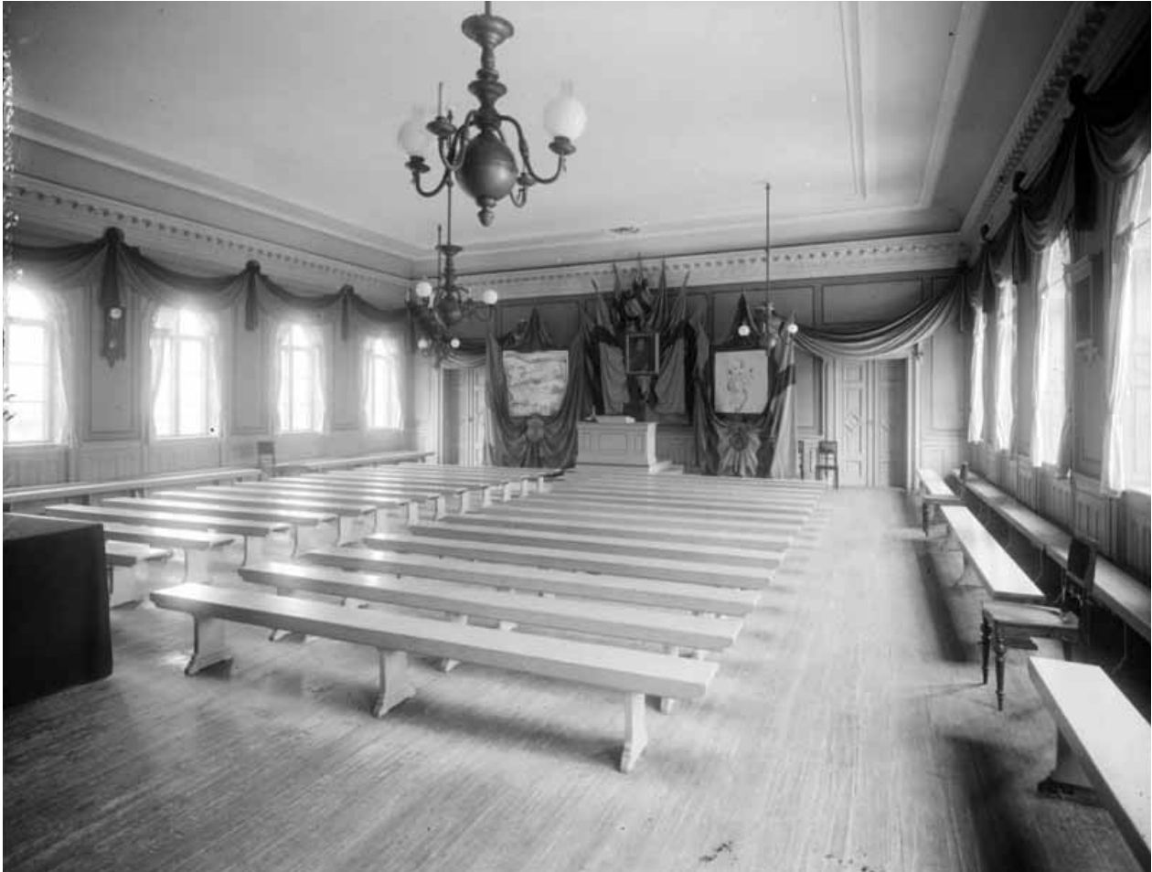
SKOLANS AULA PÅ ÖVERSTA VÅNINGEN SOM DEN SÅG UT 1912.

Under mer än hundra år, från 1700-talets första hälft till 1840-talet, fanns ett bageri på tomten. Byggnaden vid Brunnsgratan är kvar från den tiden och hade bland annat bostadsrum för bagargesällerna. Verksamheten köptes i mitten av 1800-talet av Jakobs och Johannes församlingar som lät riva en del av de äldre byggnaderna till förmån för ett skolhus i tidens stil.